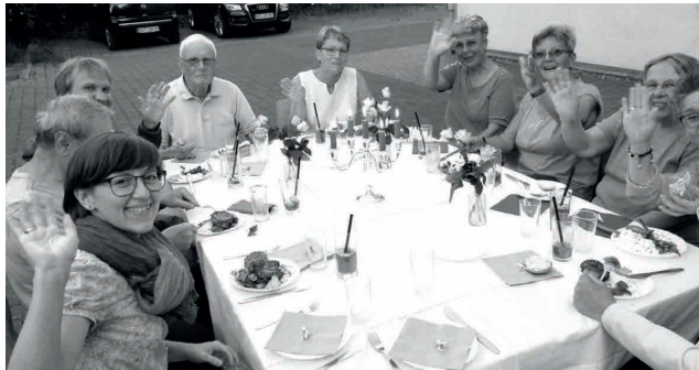
Abschlussfest: Glaube – Leicht gemacht?!