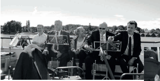
Posaunenchor on tour