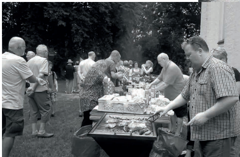
Johannistag in Mirow