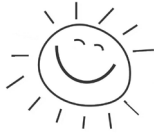
Himmelfahrtsgottesdienst am Kreuzberg