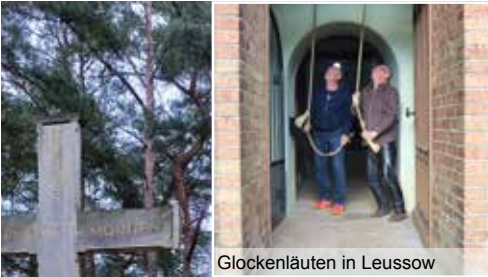
Glockenläuten in Leussow