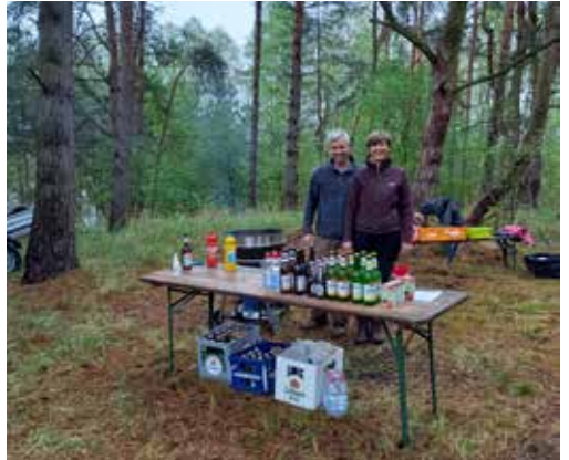
Open Air Gottesdienst Himmelfahrt