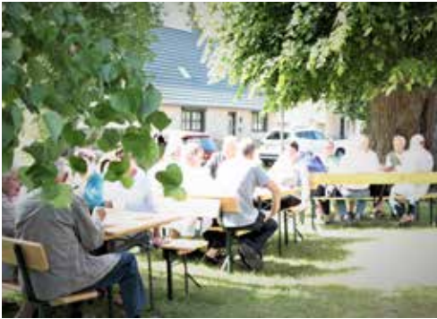
Gemeinden unterwegs in Leussow