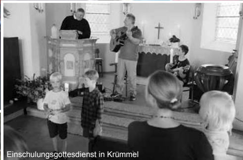
Einschulungsgottesdienst in Krümmel