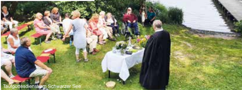
Taufgottesdienst am Schwarzer See