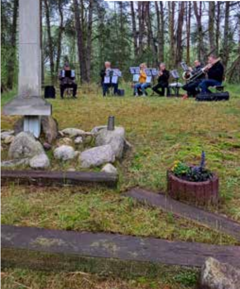
Open Air Gottesdienst Himmelfahrt